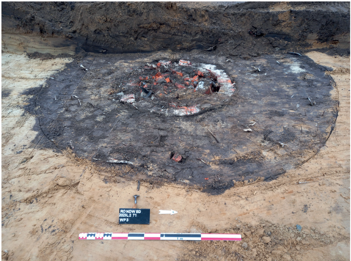
Dichtgestorte waterput met bakstenen bekisting uit de 20ste eeuw.